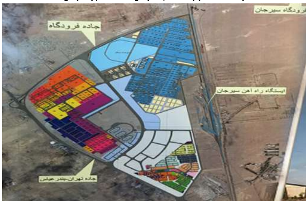
تصویر شماره ۲: نمای ورودی منطقه ویژه اقتصادی سیرجان

موقعیت منطقه ویژه اقتصادی سیرجان نسبت به شهر سیرجان