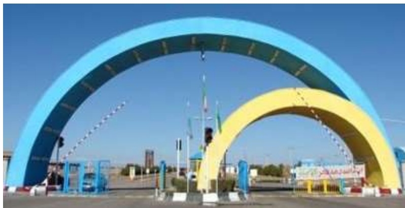
شکل و ابعاد سایت

منطقه ویژه اقتصادی سیرجان در زمینی به مساحت ۴۰۴۱۸۷ متر مربع قرار گرفته است (۴/۴ هکتار)